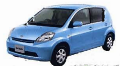
MVクラスのイメージ

主催箇所は国内旅行課です。レンタカーは利用日数で左記商品番号にて予約。会員券は利用日数に関わらず2日間で発券されますが駅名小印にて訂正の上、お渡しく下さい。予約時にMS2に配車場所・時間、返車場所・時間、チャイルドシートが必要な場合、チャイルドシートのシート名と台数を入力してください。(例4/1ハカタエキ11:00カラ4/3コクラエキ16:00マデ) ジュニアシート1台) 手仕舞5日前。満車または手仕舞後はFAXにてお申し込みください。また、手仕舞後の取消や変更は必ずFAXにて連絡してください。ご案内券に必要事項を記入願います。