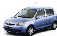
Sクラスのイメージ

※上記オプションレンタカーはこのパンフレット記載の商品と同時に申し込みにいただいた場合のみご利用いただけます。