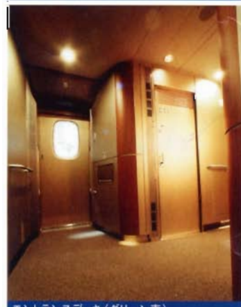
エントランスデッキ(グリーン車)