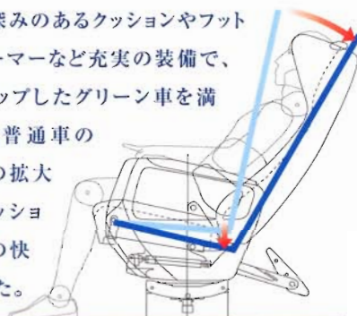
新リクライニング機構 (グリーン車)

グリーン車も、普通車も、ずっと乗っていただく快適シートです。グリーン車の座席に採用した「シンクロナイズド・コンフォートシート」は、座面と背もたれが連動してスライドするので、お客様の最も楽なポジションで座ることができます。また複合バネ構造で深みのあるクッションやフットレスト、レッグウォーマーなど充実の装備で、一段とグレードアップしたグリーン車を満喫してください。普通車の座席も、シート幅の拡大や複合バネのクッションで「普通」以上の快適性を実現しました。