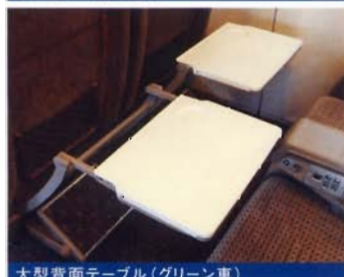
大型背面テーブル (グリーン車)