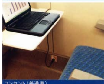
コンセント (普通車)