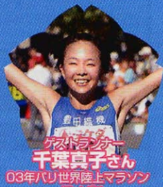
ゲストコメンタリー 千葉真子さん 03年パリ世界陸上マラソン 銅メダル