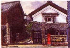
日本大正村資料館と大正の館

ご注意 この払込書は、機械で処理しますので、本票を汚したり、折り曲げたりしないでください。