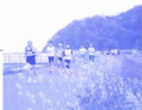
※菜の花の咲くコースは、ハーフと10kmのみ。

ハーフでも標高差20m。小浜の市街地を通り抜け、海岸通りや菜の花が咲き誇る堤防沿いの景色を楽しみながら走れるコース。