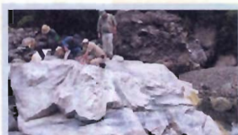
糸魚川ジオパーク 青海川ヒスイ峡 ジオサイト