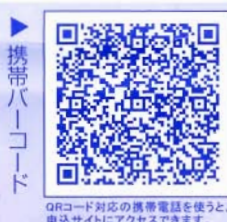
QRコード対応の携帯電話を使うと、申込サイトにアクセスできます。