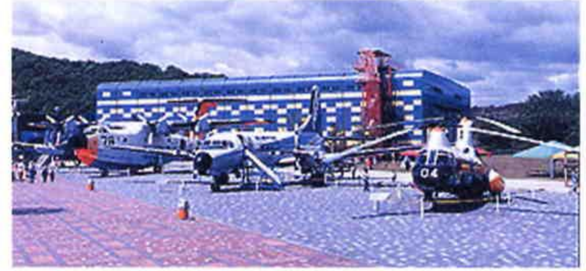
かかみがはら航空宇宙科学博物館 TEL 058-386-8500