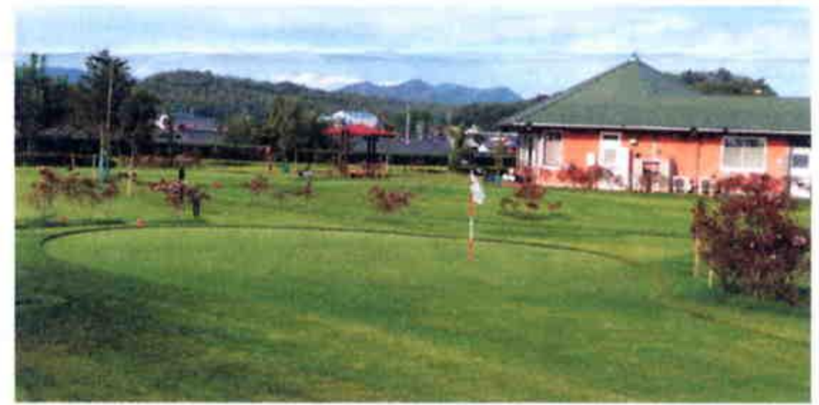
各務原リバーサイド21 パターゴルフ場 TEL 058-386-8722