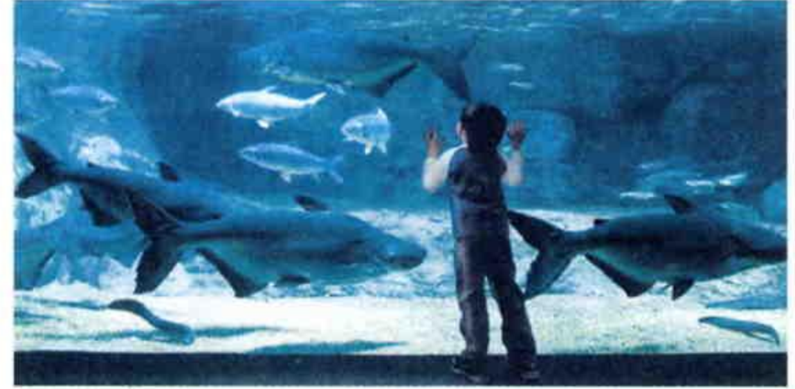
岐阜県世界淡水魚園水族館アクア・トトぎふ TEL 0586-89-8200