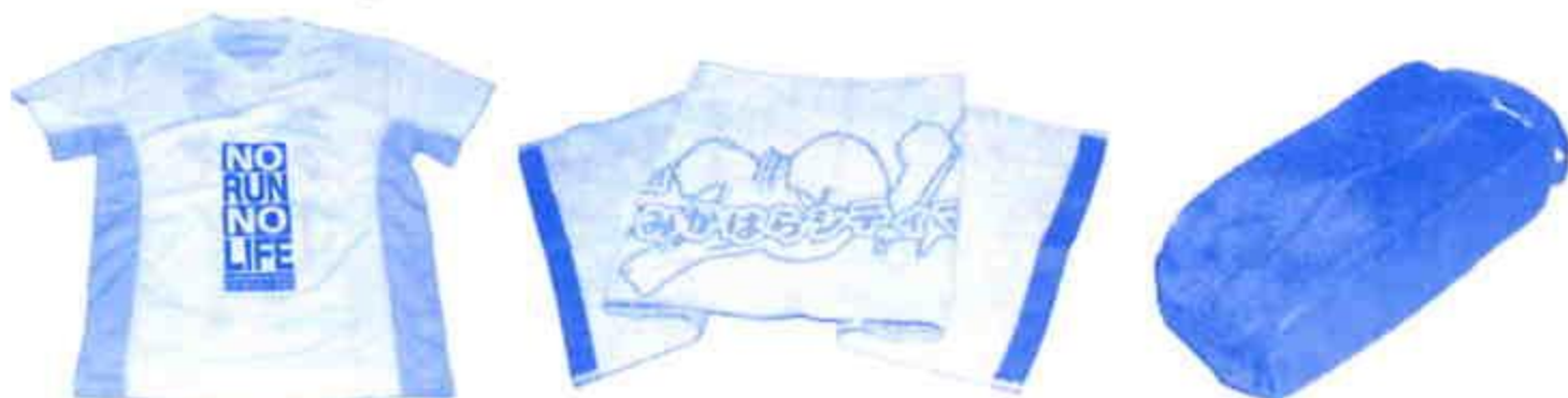
●オリジナルTシャツ ●スポーツタオル ●シューズケース