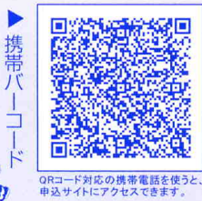
QRコード対応の携帯電話を使うと、申込サイトにアクセスできます。