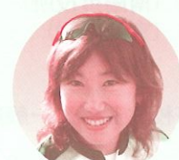
高橋 千恵美 選手 聖徳大学 シドニーオリンピック10,000M出場