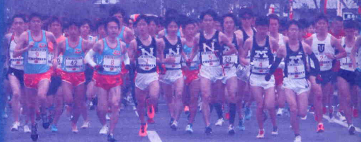
昨年のハーフマラソンスタート