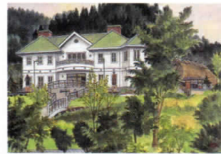
日本大正村ロマン館