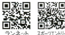
ランネット スポーツエントリー