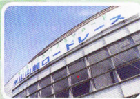
充実した館内設備をもつ、かきぎきドームがスタート、フィニッシュ地点