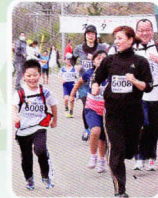
「ファンランで行こうよ」と、笑顔が素敵なランナー