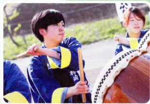
太鼓による威勢のいい応援がランナーにはうれしい