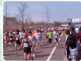
今年は記録更新できるかな?