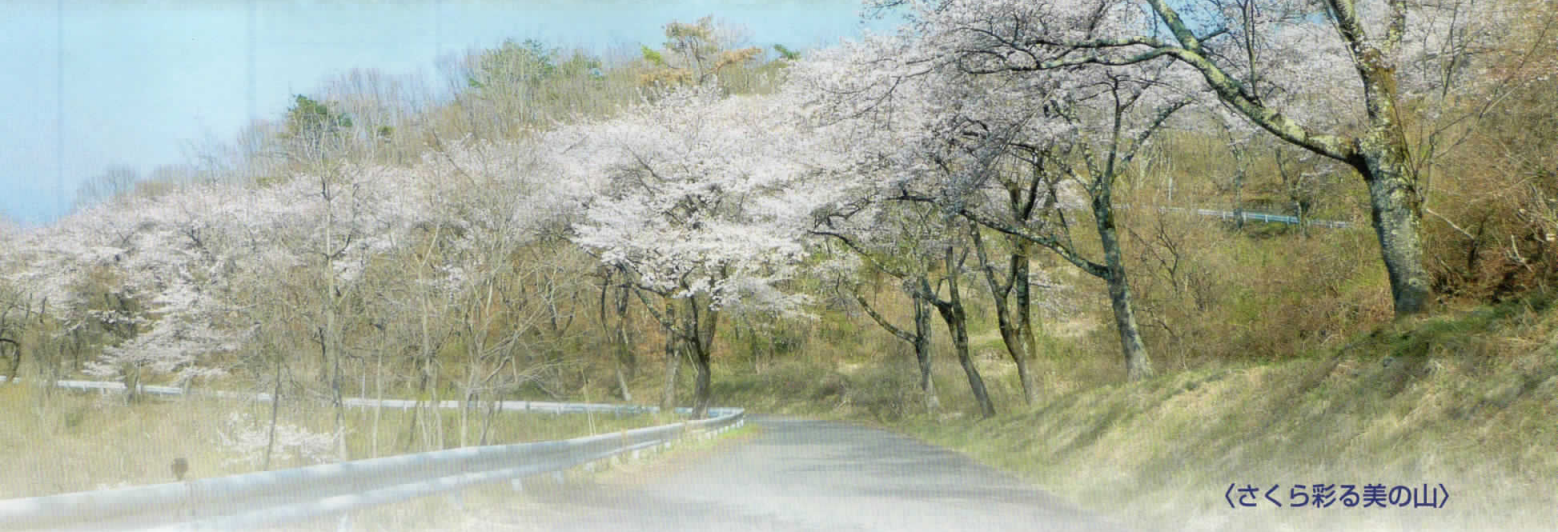
〈さくら彩る美の山〉