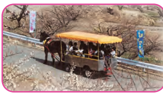
トテ馬車運行(梅林)

◎お祭当日は、JA西部営農センターが臨時駐車場となります。また、営農センターからエコール間で無料シャトルバスを運行します。