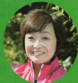
ゲストランナー 増田明美さん

会場:士別市・中央公園(北海道士別市) 種目:ハーフマラソン / 10km / 5km / 2km(ファンラン) ※ハーフと10kmは、日本陸上競技連盟公認コース