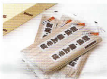
③最上早生乾そば そば乾麺セット