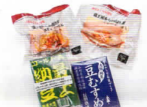
⑤低糖質食品 山形さくらんぼ鶏スモーク チキンささみ&手羽元 納豆ゴールド、豆むすめ