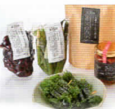
④新庄いいいりゃ風土 SHINJO ii-nya FOOD 詰め合わせセット