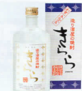
①地酒 米焼酎さら720ml 1本

一般参加者(高校生以下除く)の方に、新庄最上地域の特産物(5品中1品を選択)を差し上げます。