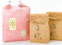
②米処新庄の自慢の米 新庄産つや姫 1kg 新庄産さわのはな 600g