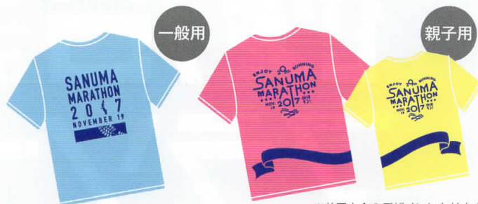
※前回大会のデザインになります