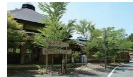
木の根ふれあいの森