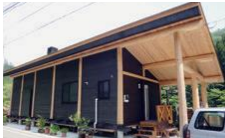
ログ 柵 (ひいらぎ)

吾川郡いの町越裏門246-5 1泊2食6,500円～ ☎088-869-2861 090-8280-5478