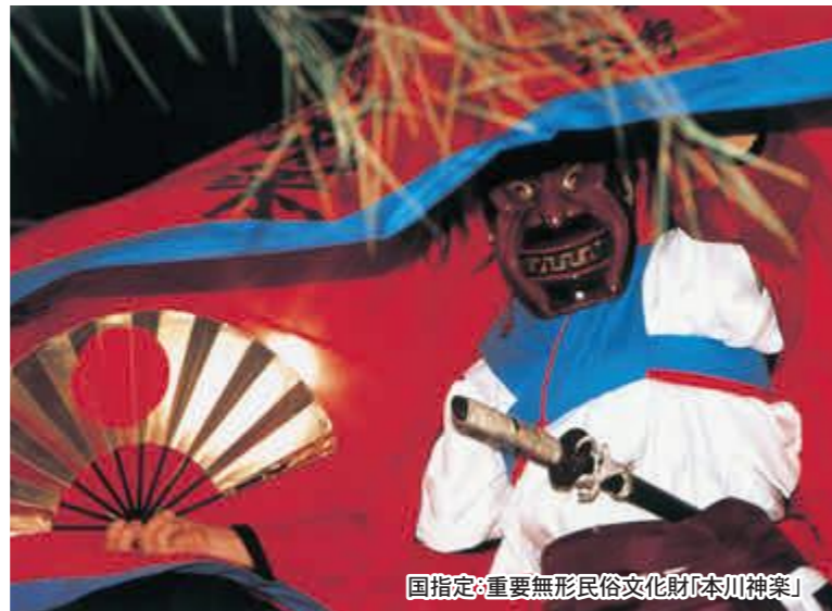
国指定重要無形民俗文化財「本川神楽」