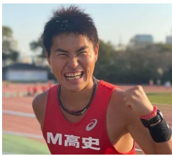
MC & ゲストランナー

潮の香りを楽しみながら、気持ちの良い汗をかきましょう！ 大会後はシーパラダイスに行ったり、公園内のバーベキューで楽しんだり1日中楽しめますヨ♪