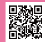
▲大会ホームページ