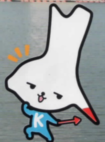
神栖市イメージキャラクター かみスコくん