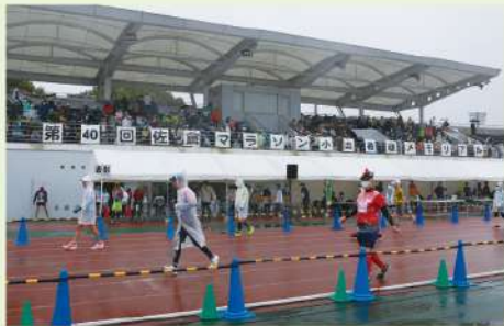
会場: 岩名運動公園 小出義雄記念陸上競技場