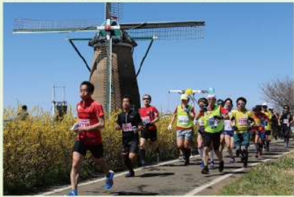
オランダ風車(リーフデ)